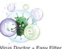
Virus Doctor + Easy Filter