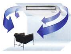
แขวนใต้ฝ้า กระจายลมซ้าย-ขวาอัตโนมัติ