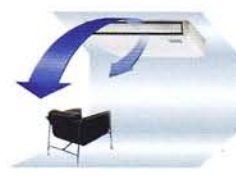
แขวนใต้ฝ้า กระจายลมขึ้น-ลงอัตโนมัติ