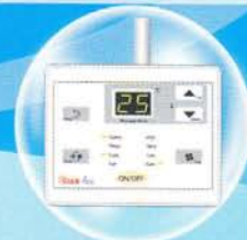
Remote Control มีสายแบบ Digital