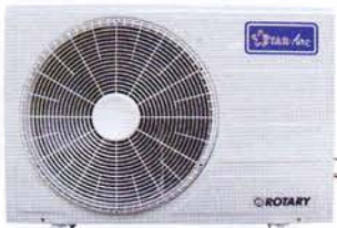
Model ARN12 - ARN25