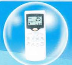
Remote Control ไร้สายแบบ Digital

เครื่องปรับอากาศคุณภาพสูง ผลิตจากโรงงานที่ได้รับการรับรองมาตรฐาน ISO 9001:2008, ISO 14001:2004, TIS18001:2554, OHSAS 18001:2007