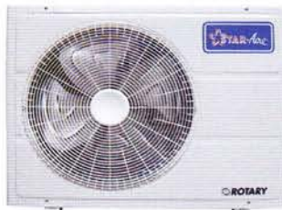
Model ARN29 - ARN36