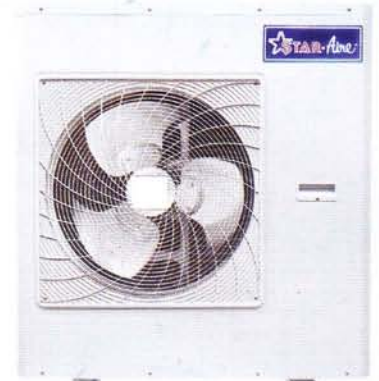
Model ARE44 - ARE60