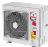
Model : CCS-32IVGX40, 48