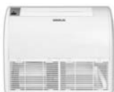
Model : CFH-32IVGX13, 18