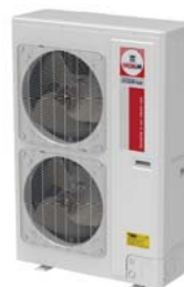
Model : CCS-32IVGX60