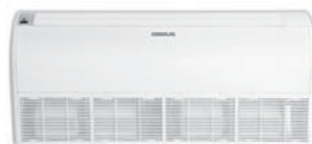
Model : CFH-32IVGX36, 40, 48, 60