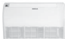
Model : CFH-32IVGX24, 30