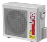
Model : CCS-32IVGX36