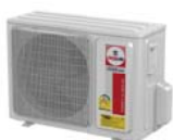
Model : CCS-32IVGX13, 18