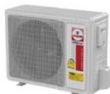
Model : CCS-32IVGX24, 30