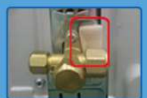
ติดตั้งติกเกอร์ป้องกันในช่องที่กว้างกว่า 4 มม.