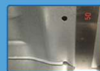
ลดขนาดของช่องที่จิ้งจกเข้าถึงแผงวงจรลงให้น้อยกว่า 4 มม.

ปัญหาจิ้งจกทำความเสียหายให้แผงวงจรเป็นปัญหาที่พบบมาก ในต่างจังหวัดทำให้ลูกค้าไม่กล้าใช้งานเครื่องปรับอากาศระบบอินเวอร์เตอร์ โดทึบจึงลดขนาดของช่องต่างๆ ที่สามารถเข้าถึงแผงวงจรลงให้น้อยกว่า 4 มม. เพื่อป้องกันไม่ให้จิ้งจกและสัตว์อื่นๆ เข้าไปทำความเสียหาย