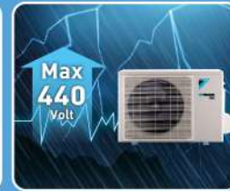
Super PCB Pro ทำงานได้แม้ไฟตก 150 โวลต์ นไฟกระชากสูงสุด 440 โวลต์