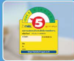
ประหยัดไฟเบอร์ 5 กลุ่ม ด้วยระบบอินเวอร์เตอร์แบบสวิต