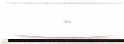
HSU-24CTR 03T ราคา 32,900 บาท

24,095 BTU ขนาด ก x ล x ส (มม.) 1125 x 240 x 335 SEER 14.0