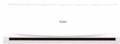
HSU-13CTR 03T ราคา 18,900 บาท

12,665 BTU ขนาด ก x ล x ส (มม.) 865 x 200 x 290 SEER 13.6