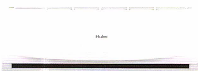
HSU-18CTR 03T ราคา 27,900 บาท

18,177 BTU ขนาด ก x ล x ส (มม.) 1008 x 318 x 225 SEER 13.2