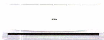
HSU-10CTR 03T ราคา 15,900 บาท

10,238 BTU ขนาด ก x ล x ส (มม.) 865 x 200 x 290 SEER 14.1