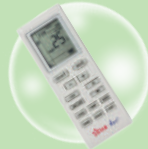
รีโมทคอนโทรล ไร้สายแบบ Digital