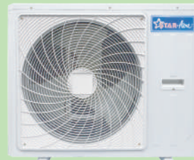
Model CR18 - CR33 Model CR30-3 - CR33-3

ได้รับมาตรฐานผลิตภัณฑ์อุตสาหกรรม เครื่องปรับอากาศ สำหรับห้องแบบแยกส่วนระบายความร้อนด้วยอากาศ (มอก.1155-2557)