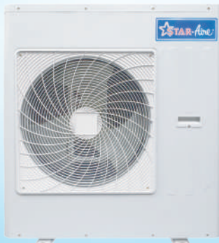
Model CR 45 - CR 48