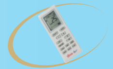
รีโมทคอนโทรล ไร้สายแบบ Digital